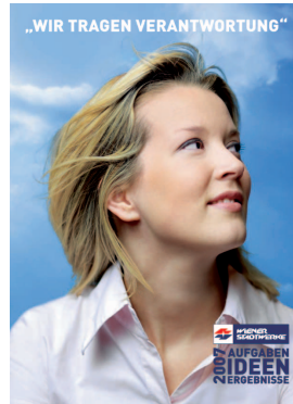
Wiener Stadtwerke Geschäftsbericht 2007

Der Geschäftsbericht 2007 der Wiener Stadtwerke flirtet geradezu mit den Lesern. Mitarbeiter kommunizieren mit persönlichen Statements die Aufgaben, die ein Unternehmen wie die Wiener Stadtwerke zu bewäl-